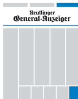
Titelseite Titelkopf 92 x 19,7 mm Titelseite Griffecke 47 x 72 mm